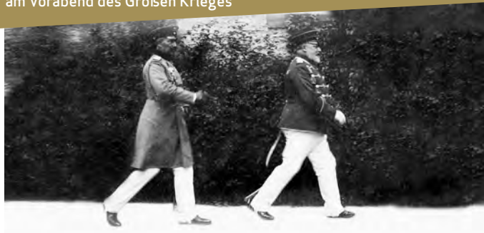
Wilhelm II. und sein Onkel König Edward VII. von Großbritannien, Foto: Stadtarchiv Bad Homburg v.d.Höhe

Wegscheide im Taunus. Schloss Friedrichshof und das Homburger Schloss als Brennpunkte der Weltgeschichte am Vorabend des Großen Krieges