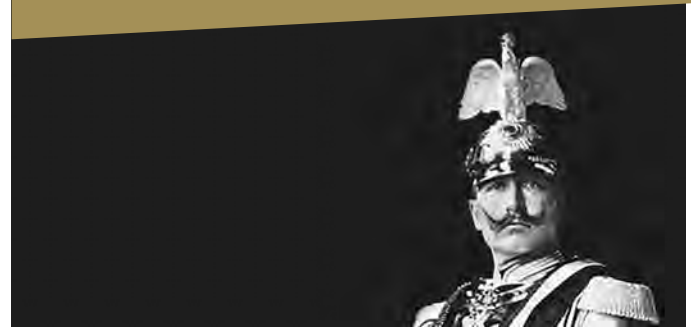
Kaiser Wilhelm II., Postkarte 1905

Zerrbild, Sinnbild, Wunschbild. Kaiser Wilhelm II. im Blick der literarischen Moderne