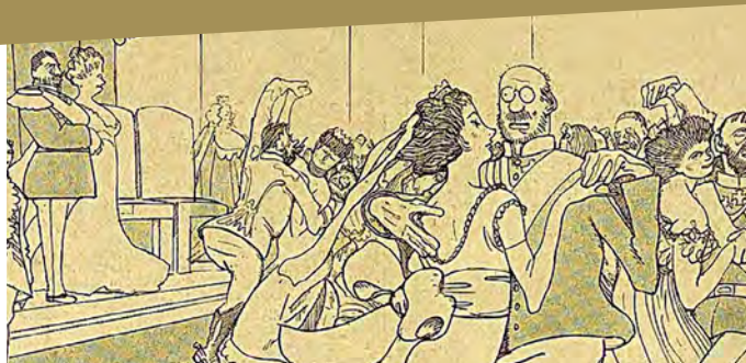
Karikatur aus dem Jahr 1913. Der traditionelle Fackeltanz erscheint als »Wackeltanz«

Hof und Hofgesellschaft unter Wilhelm II.