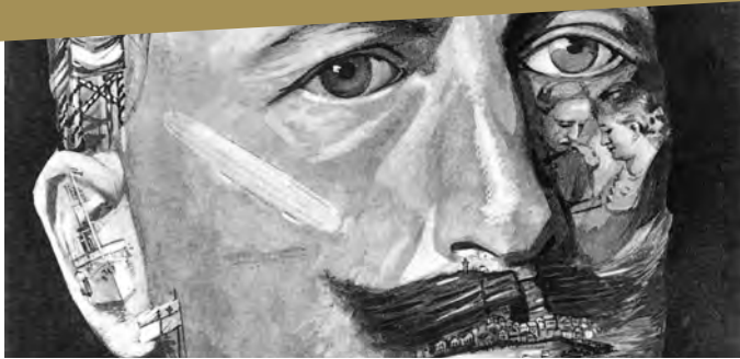
Zeitgenössisches Porträt Wilhelms II. Im Gesicht des Kaisers spiegeln sich wichtige Ereignisse seiner Regierungszeit

Chancen und Scheitern des »Medienkaisers« Wilhelm II.