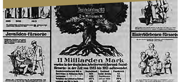
Zeitgenössisches Schaubild zu den Vorzügen der deutschen Sozialversicherung

Ein wilhelminisches Wirtschaftswunder? Wirtschaft und Gesellschaft 1890-1914