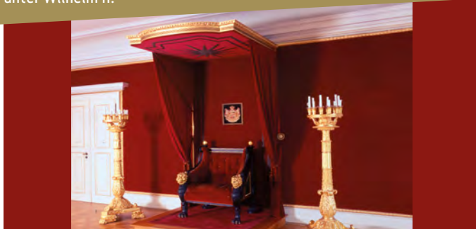
Landgrafensaal mit Thronessel und Baldachin, Schloss Bad Homburg

Die parlamentarische Monarchie am Ende der Sackgasse? Potentiale und Probleme des politischen Systems unter Wilhelm II.