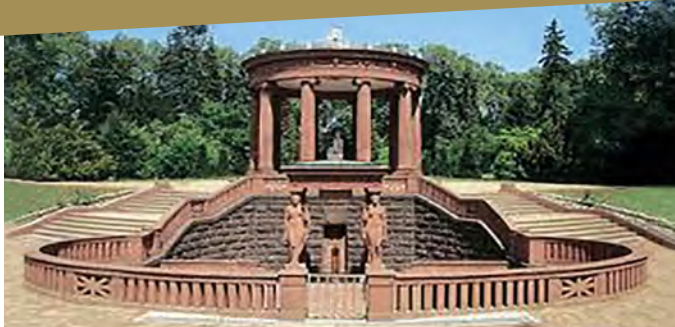
Elisabethenbrunnen, Bad Homburg

»Wilhelminische« Erinnerungsorte in Bad Homburg v.d.Höhe