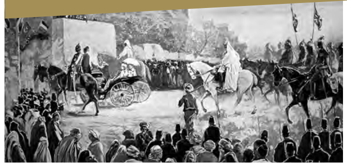
Einzug des Kaisers und der Kaiserin in Jerusalem

Religion und Religionspolitik Kaiser Wilhelms II. im Kontext