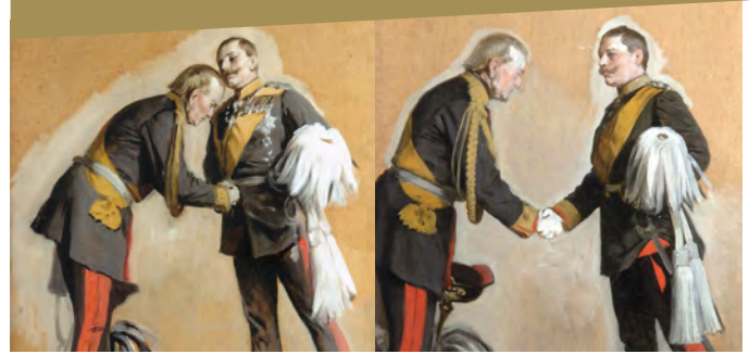
Anton von Werner, Helmuth von Moltke und Kaiser Wilhelm II., zwei Entwürfe für das 1896 gemalte Bild »Moltkes 90. Geburtstag«

Das Wilhelminische und das Moderne. Die Malerei in Deutschland 1871 bis 1914