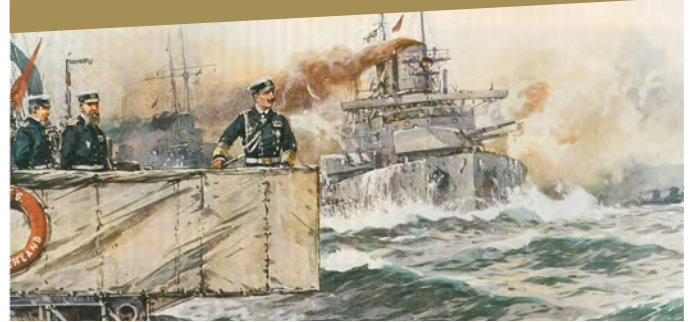
Kaiser Wilhelm an Bord des Linienschiffes Deutschland. Gemälde von Willy Stöwer 1912

Der Kaiser und der Funk. Zur Einheit von Persönlichem und Politischem bei Wilhelm II.